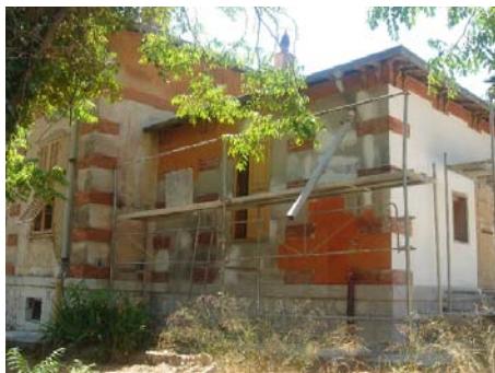
Pavillon de Physique : essais de couleur (26 juillet)