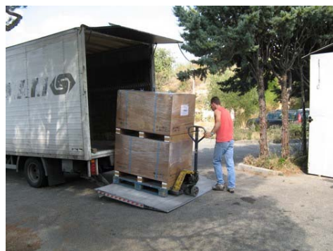
Au revoir VEGA ! (13 août)