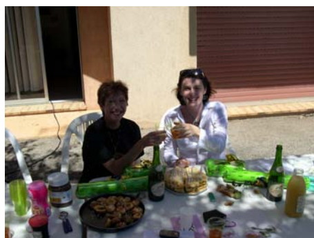
Bon anniversaire !(9 août)