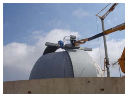
Coupole laser-Lune : on a démonté en juillet, on remonte en août